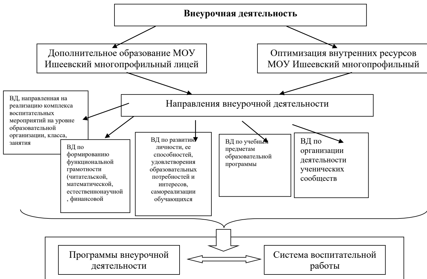
Рис. 1. Модель организации внеурочной деятельности МОУ Ишеевский многопрофильный лицей.

Внеурочная деятельность лицея предполагает, что в ее реализации принимают участие все педагогические работники. Координирующую роль выполняет классный руководитель, который в соответствии со своими функциями и задачами: